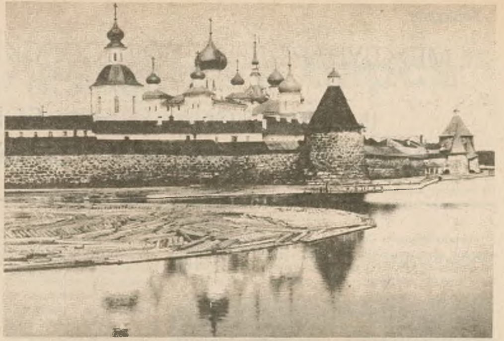
Выгляд манастыра з усходняга боку

І мы, нібыта скары-стаўшыся парадай вялікага рэжысёра, накіраваліся ў далёкі шлях. Аб чым цяпер і хочам расказаць.