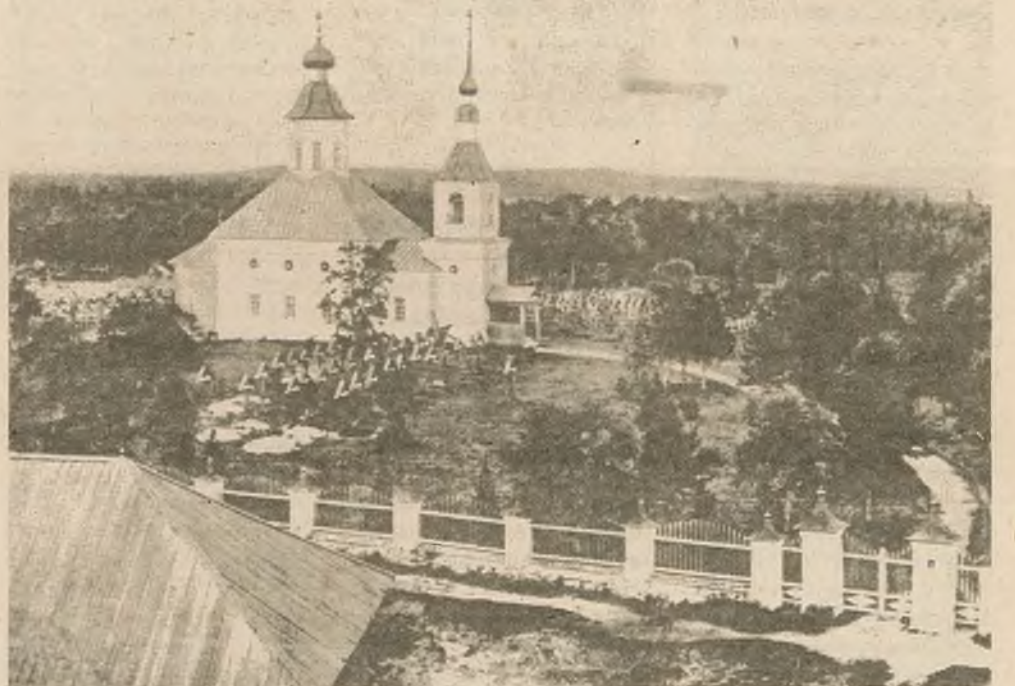
Выгляд часткі манастырскага цвінтара з царквой на ім у імя прападобнага Ануфрыя Вялікага