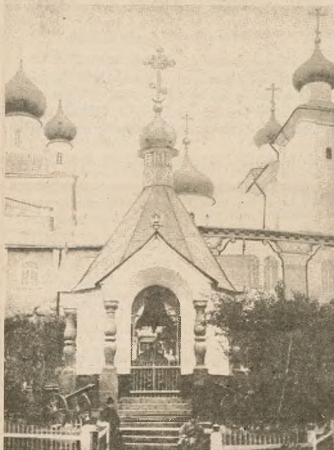
Выгляд царскай званіцы з пірамідай знутры з англійскіх ядзер і бомб